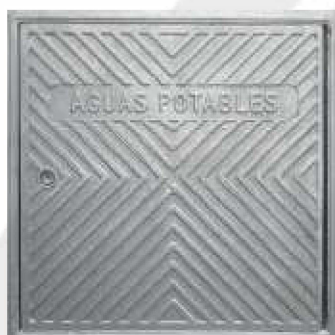
■ Ref. 706, 711, 712, 715

Características: Modelos realizados en fundición de aluminio, con marcos desmontables (solo las rectangulares) para facilitar la instalación. Se suministran con cerradura de llave allen o de la compañía de aguas que requiera el municipio.