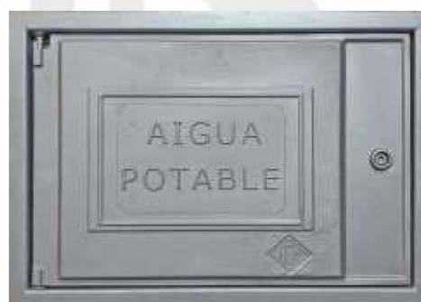
■ Ref. 709 y 710